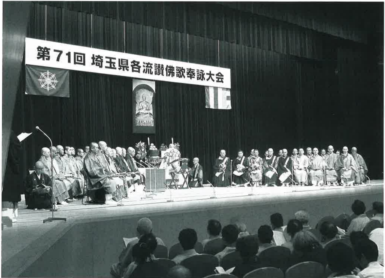
奉詠大会法要（埼玉会館・令和元年9月30日〔月〕）