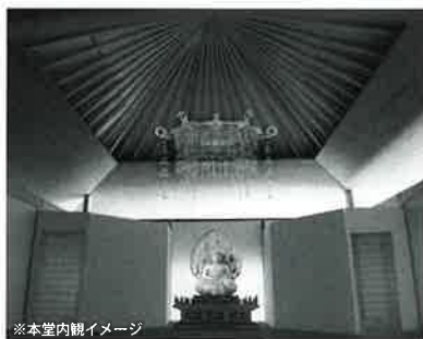
※本堂内観イメージ