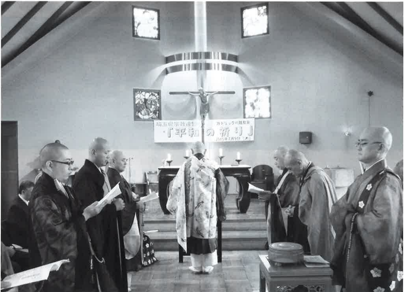
埼玉県宗教連盟「平和の祈り」(カトリック川越教会)