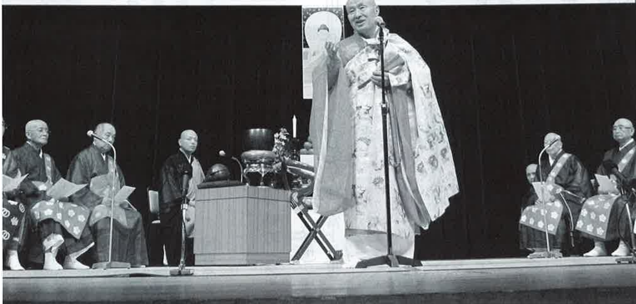
第63回 埼玉県各流讃佛歌奉詠大会 (埼玉会館)